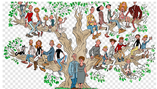
Généalogie : initiation et logiciel 211

Sous nos yeux, et sans que nous nous interroguions, c'est un roman historico-géographique qui s'étale sur des centaines