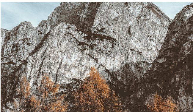
Conférence : le paysage géologique du Tricastin 605

Programme complet, adhésion et inscription sur notre nouveau site